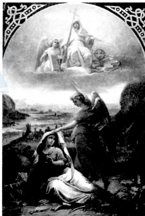
Gheorghe Tattarescu, Deșteptarea României , 1855, detaliu, Muzeul Național de Artă al României, București